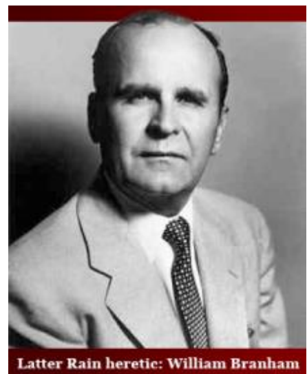
Latter Rain heretic: William Branham

Yksi keihäänkärki, joka suuresti vaikutti myöhäissateen uuden järjestyksen (NOLR) "herätykseen" ja myöhäissadelikkeeseen, oli William Branham. William Branham vaikutti voimakkaasti Hillsong'in perustaja Frank Houston'iin Gordon Lindsay'n kirjan A Man Sent From God (Suomeksi: Jumalan lähettämä mies , Ristinsanoma 1962) kautta. Kun helluntailaisuus jo tuomitsi Latter Rain -liikkeen ja Uuden Seelannin Pelastusarmeija ja Baptistit ottivat etäisyyttä Uuden Seelannin AOG:hen (johon oli soluttautunut Latter Rain'in heittoitä), niin on helppo nähdä, miksi Frank Houston kiipesi nopeasti Uuden Seelannin AOG:n huipulle: hän täytti kaikki NOLR:n apostoliset ja profeettalliset edellytykset.